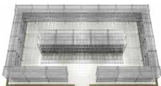
• Rayonnage fixe