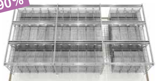
• Rayonnage suspendu